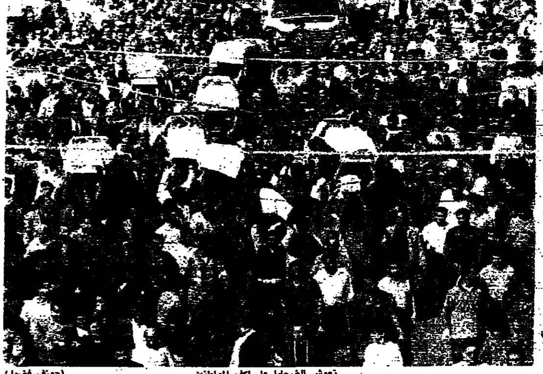
تموش الضحايا على اكله المواطنين (جوزف فصول)

معلمة تجت من الموت تكفي من زوجها اولادها الثلاثة امام نحوهم ضحايا مجزرة الخطف، شيعوا امس وسط ذمول القادات والفاعليات، والسخط الشعبي الذي تم التعبير عنه بالاقبال العام وكان العنوان البارز في النشاط على الساحة الشرقية والبلدانية، من خلال زيات الفعل على المجزرة التي حصلت امس الاول، بحيث لم يات اي تصريح لأي قيادي خلوا من استنكار واستهجان لما حصل. وعند الثالثة بعد ظهر امس، ووسط موجة حزن عارمة، وبمشاركة جمهور كبير من المواطنين يقفهم قائد منطقة جبل لبنان اللواء جورج حورق ممثلاً رئيس مجلس الوزراء العماد ميشال عون، والنايب بيار كلاس، ورئيس الجبهة اللبنانية، انهنين ذاتي شموعاً وترغماً لروكان الجبهة، فضلاً عن الحشيد من الشخصيات السياسية والدينية والعسكرية والفعلية، تم تطبيع ضحايا المجزرة في كتيبة السيدة في الحدث، حيث راس الصلاة الابائي بوشا تنوري وماونو لفيق من الكهنة والاباء. وكانت الجريمة لغيت موجة استنكار عارمة، عبرت عنها